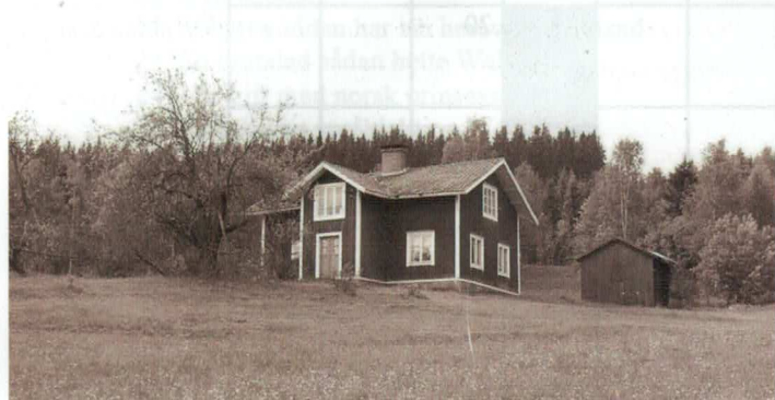
Basen "Juno" – Kösstorp som det såg ut under kriget, nu finns bara resterna av grunden kvar.