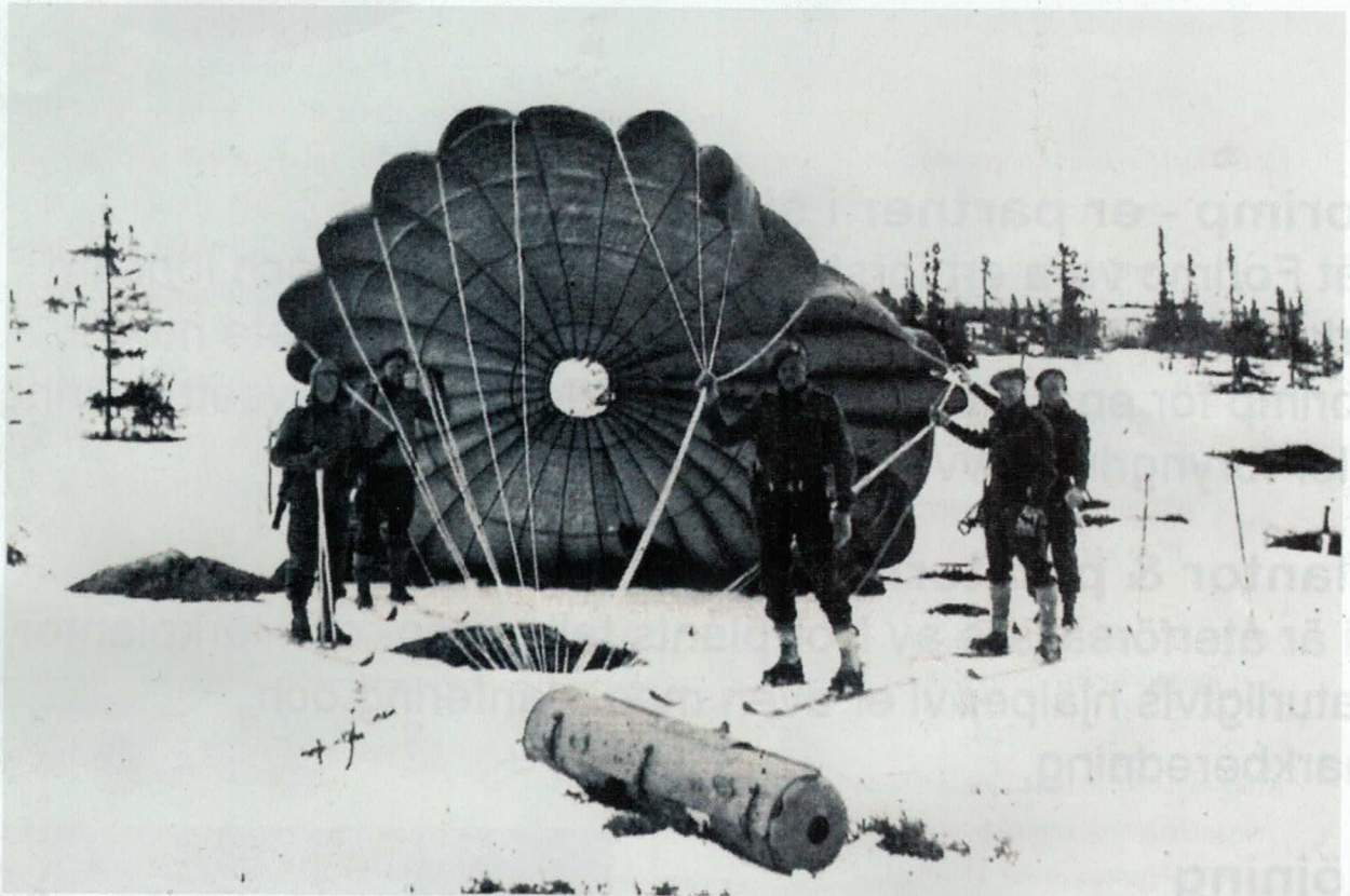
Hemliga baser med kommandosoldater i Gunnarskog under Andra Världskriget. Se sid 18.